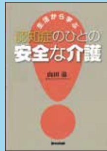
③ 生活から学ぶ 認知症のひとの安全な介護