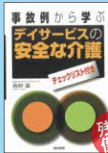
② 事故例から学ぶ デイサービスの安全な介護 チェックリスト付