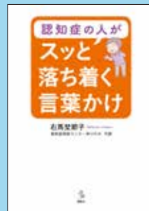
⑦ 認知症の人が スッと落ち着く言葉かけ