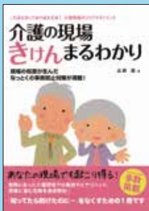
⑤ 介護の現場 きげんまるわかり