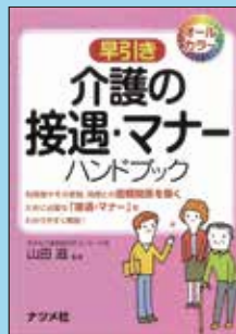
⑥ 介護の接遇・マナーハンドブック