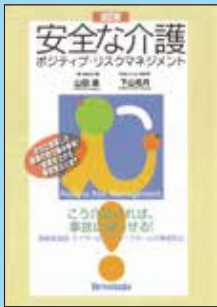
① 安全な介護 改訂版 ポジティブ・リスクマネジメント