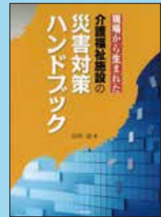
④ 現場から生まれた介護福祉施設の災害対策ハンドブック