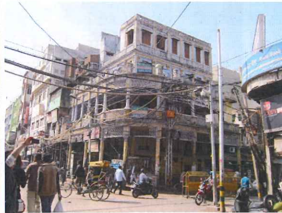
(混沌のオールドデリーを歩いて散策する)